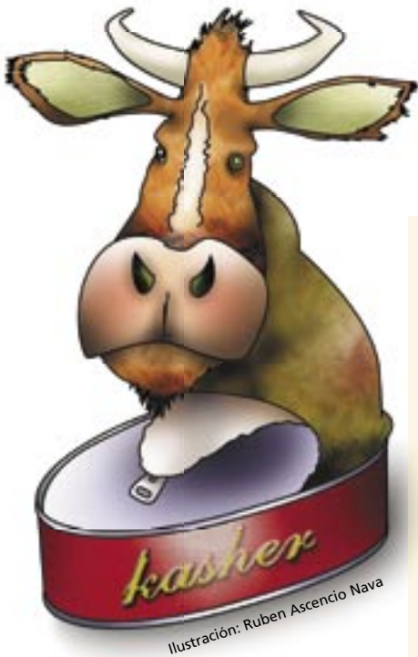
Ilustración: Ruben Ascencio Nava

and seafood such as crabs, lobsters and shrimp are not kosher and neither are aquatic mammals such as dolphins, whales and sea lions, as well as the rest of animals such as octopus, squid and jellyfish.