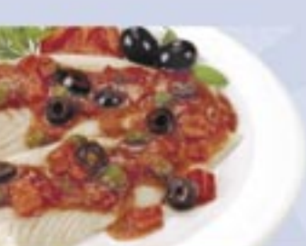
Patagonian Silver Hake Fillets with Sicilian Sauce