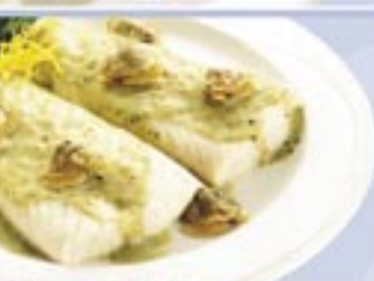
Patagonian Silver Hake Fillets and Clams with Green Sauce