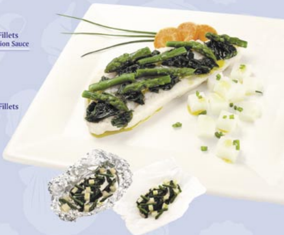
Patagonian Silver Hake Papillote with Mix of Vegetables (Spinach, Asparagus and Potatoes)