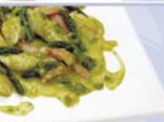
Patagonian Silver Hake Fillets and Red Crab with Asparagus and Saffron Sauce