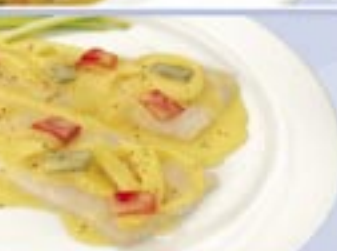
Patagonian Silver Hake Fillets with Yogurt Sauce