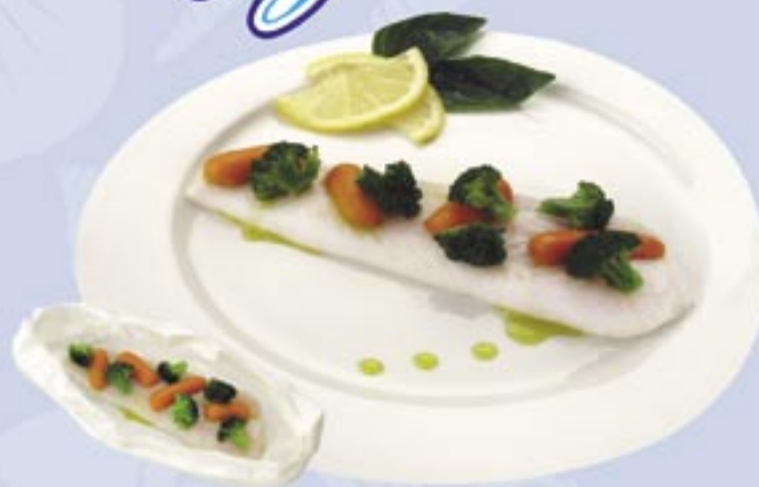
Patagonian Silver Hake Papillote with Broccoli and Baby Carrots