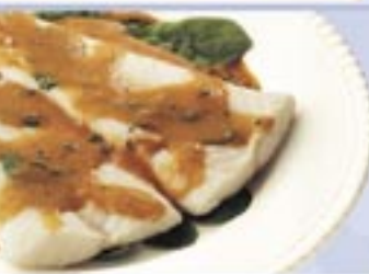
Patagonian Silver Hake Fillets with Rucola Sauce