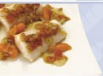
Patagonian Silver Hake Loins with Baby Carrots and Potatoes