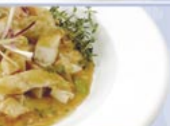
Patagonian Silver Hake Fillets with Tomato and Green Onion Sauce