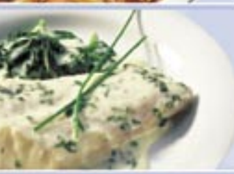
Patagonian Silver Hake Fillets with Spinach Sauce