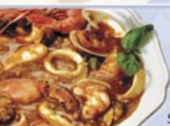
Sicilian Sea Fantasy