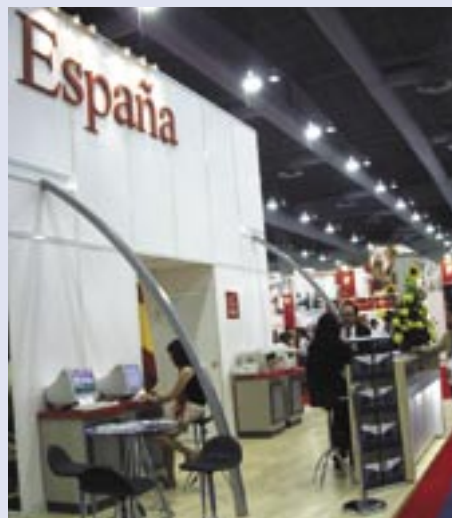
Cerca de 30 países estuvieron representados en el evento. España, uno de los más importantes.

10,339 compradores profesionales de 28 países 399 compañías expositoras de 27 países con productos innovadores 144 asistentes al 2º Congreso Mexicano de Gastronomía-Tendencias Alimentaria 2006 11,509 m 2 de área total