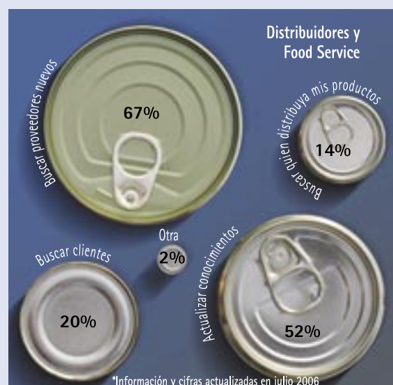
*Información y cifras actualizadas en julio 2006 Razón por la que se visitó Alimentaria México 2006.