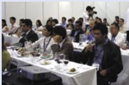
Uno de las actividades más concurridas fue la cata de vinos.